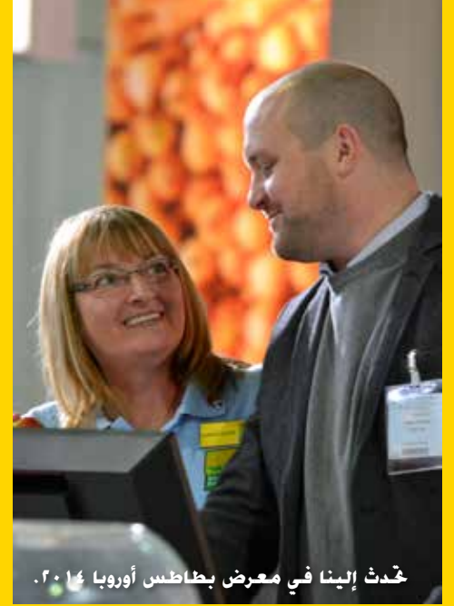
حدث إينا في معرض بطاطس أوروبا ٢٠١٤.

خبراء تخزين المحاصيل الدوليون، مؤسسة Sutton Bridge Crop Storage Research (SBCSR)، تحتفل بإجازة يتمثل في ٥٠ عاماً من أبحاث التخزين هذا العام، مؤسسة SBCSR التي تم تأسيسها في عام ١٩٦٤ أصبحت رائدة عالمياً في تكنولوجيا تخزين المحاصيل، كما أن خبراءها الدوليين سوف يكونون متواجدين في الجناح للمساعدة في احتياجات تخزين المحاصيل.