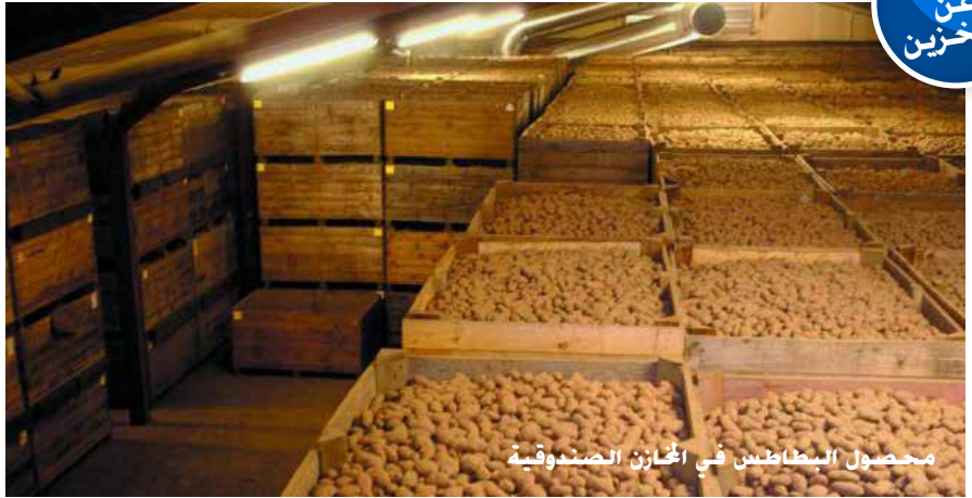
محصول البطاطس في المخازن الصندوقية

موقع إلكتروني: www.potato.org.uk/crop-storage/about-sutton-bridge-csr