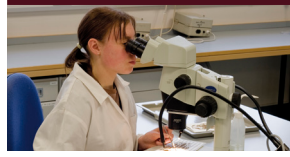
تحديث الصحة النباتية: اختبار بكتريا الديكيا السنوي